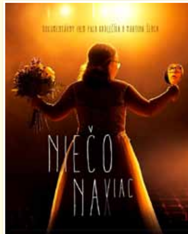
Dokumentárny film, Slovensko, 2017, 67 min. Hudba: Ľubica Čekovská Réžia: Palo Kadlečík, Martin Šenc

Vďaka blízkeho kontaktu s protagonistkou filmu postavenému na dôvere a priateľstve sa podarilo nakrútiť nielen jej bežné fungovanie, ale aj jej osobný, intimný svet. Charakterom výpovede nemá tento dokument v kontexte slovenského filmu obdobu. Skladbou situácií a momentov vzniká príbeh, ktorý podáva svedectvo o tom, že ľudia s Downovým syndrómom majú skutočne niečo (na) viac. Niečo, čo ich nerobí nadbytočnými ani menejcennými. Práve naopak, film búra mýty a predsudky o tomto syndróme a pomáha pochopiť, že ľudia s touto diagnózou dokážu byť prínosom tak pre svoju rodinu, ako aj pre spoločnosť. Netreba sa báť dať im šancu, pretože majú na to, aby sa jej nielen chopili, ale ju aj niekoľkonásobne vrátili.